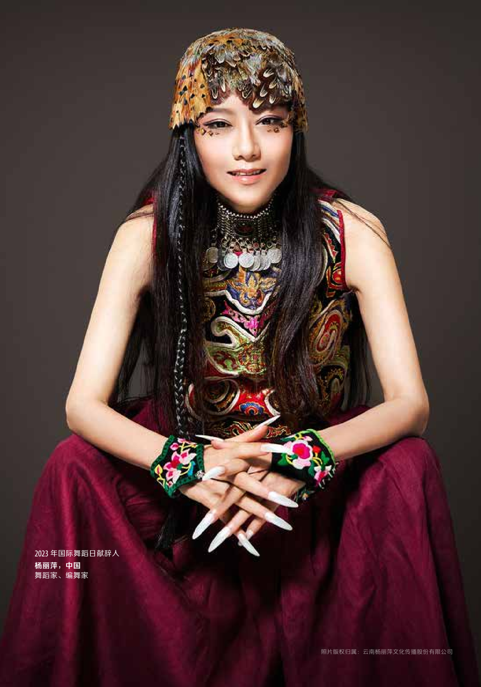
2023 年国际舞蹈日献辞人 杨丽萍，中国 舞蹈家、编舞家